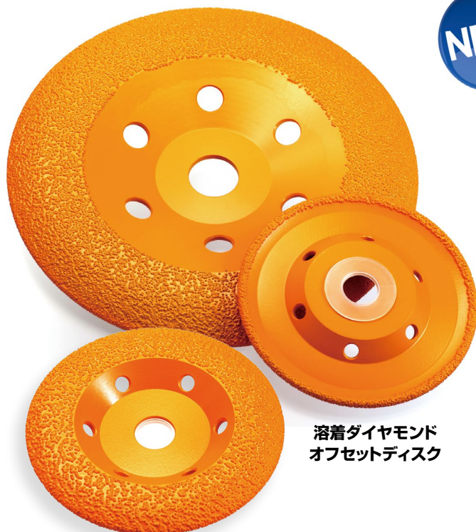
溶着ダイヤモンド オフセットディスク

The amount of resinoid grindstones discarded from the factory is very large. Therefore, from the viewpoint of environmental protection, there is an urgent need to switch to cleaner alternative products in recent years.