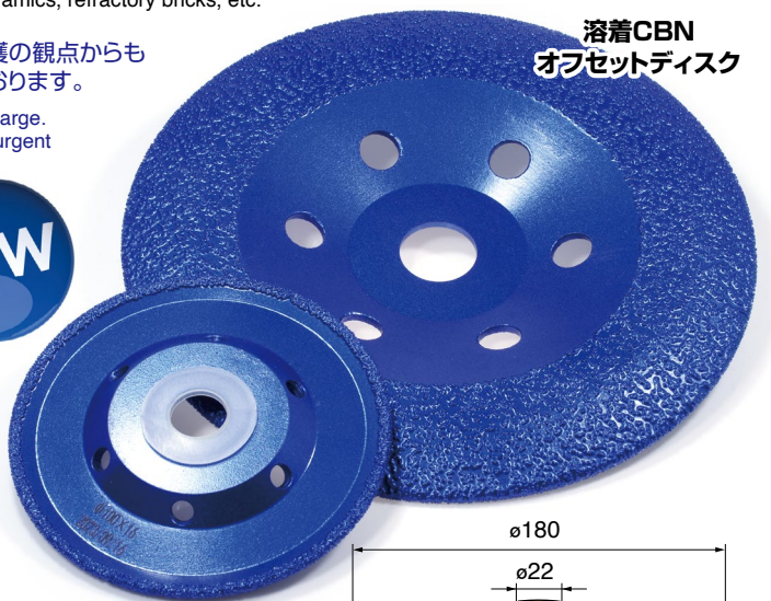
溶着CBN オフセットディスク